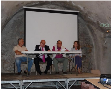
le maire et le directeur de l'AMP