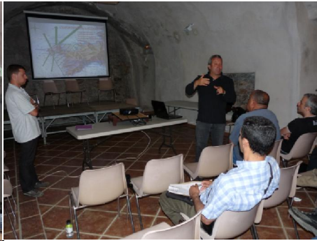
Présentation du parc marin gestion et concertation