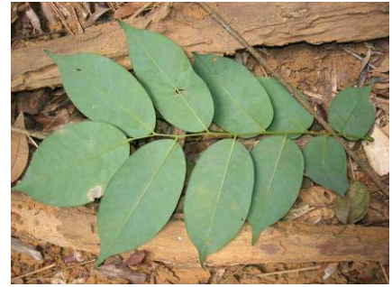
Fig 8: Ex. d'une feuille composée (movingui Distemonanthus benthamianus Caesalpiniaceae)