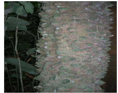
Fig 11 : Ex. d'écorce épineuse (Olon, Zanthoxylum heitzii , Rutaceae)