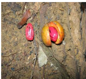
Fig 14 : Fruit du niové Staudtia gabonensis Myristicaceae

A chaque fois qu'une espèce était rencontrée, à côté de la description des organes précédemment énoncés, les fruits ont été aussi pris en compte. Les observations ont été faites sur des vieux, ou des jeunes fruits lorsque ceux-ci étaient disponibles, après une fouille sous la couronne ou en regardant en l'air. Des notes portant sur les types de fruits ont été données : fruits secs (gousses, capsules, samares, méricarpes etc.) et charnus (drupes et baies). Les figures 14, 15, 16 et 17 reprennent quelques fruits observés lors de la formation.