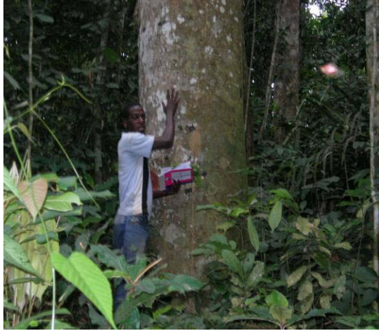
Fig 18 : Exemple d'un empatement (tchitola Prioria oxyphylla , Ceesalpinaceae)