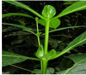
Fig 7: Ex. de feuilles simples opposées (bilinga, Nauclea diderrichii , Rubiaceae)