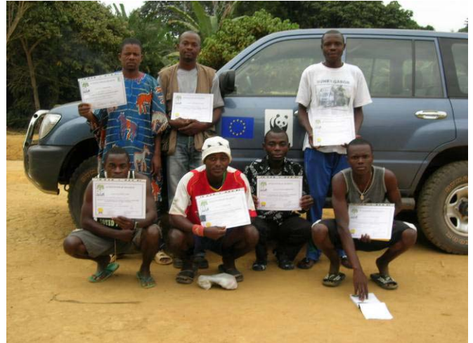
Fig 22 : Remise des attestation de réussite aux participants.