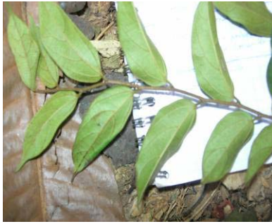
Fig 6 : Ex. de feuilles simples alternes (diania, Celtis tessmannii , Ulmaceae)