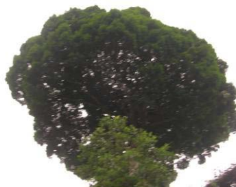
Fig 4 : Observation du feuillage et de la cime d'un arbre (andok, Irvingia gabonensis Irvingiaceae)

Sur ce point, l'accent a été mis sur l'observation du feuillage (léger ou dense), de la disposition des branches (étagées, verticillées, en roues de vélo, parallèles ou inclinées), l'aspect de l'écorce extérieure (couleur et reliefs), la forme du tronc (rectitude, cannelures ou autres) et la base (types de racines).