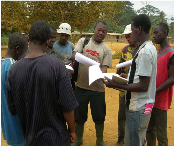
Fig 2 : Explications sur l'utilisation de supports de formation.