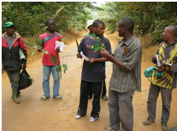
Fig 20 : Révision

Pour garder en éveil les connaissances acquises, des révisions ont à chaque fois été entreprises lorsque certaines essences déjà observées ont été de nouveau rencontrées. Pour vérifier le niveau d'assimilation des enseignements, un jeu de questions/réponses a été initié. Le principe consiste à récolter discrètement des échantillons d'organes (feuilles et fruits) d'espèces déjà étudiées et de les soumettre aux participants pour leur détermination (fig 20).