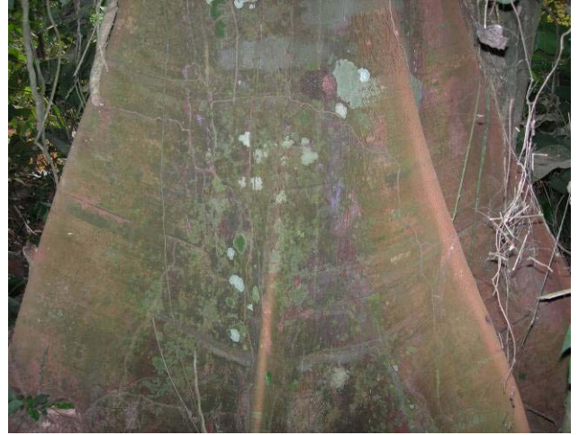
Fig 19 : Exemple de racines contreforts (Dabéma Piptadeniastrum africanum , Mimosaceae)