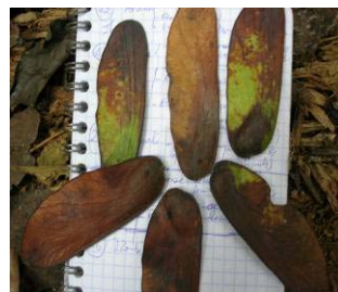
Fig 16 : Fruit de tchitola Prioria oxyphylla Caesalpiniaceae