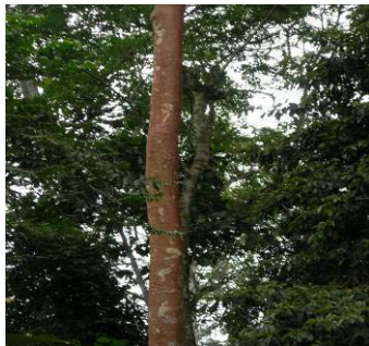
Fig 9 : Ex. de couleur et d'aspect extérieur d'une écorce (movingui Distemonanthus benthamianus Caesalpiniaceae)

En fonction des espèces, l'accent a été porté sur les caractères aussi bien extérieurs (couleur, présence ou pas d'écaillles ou de fissures, forme des écaillles et des fissures, présence ou pas d'épines ou de lenticelles) qu'intérieurs (couleur, écorce granuleuse, cassante, fibreuse ou se détachant en lanières) ainsi que les variations diverses en fonction du milieu et de l'âge.