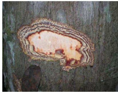
Fig 10 : Ex. de couleur et d'aspect intérieur d'une écorce (diania, Celtis tessmannii , Ulmaceae)