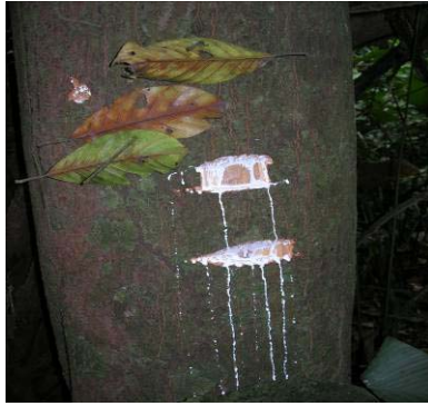
Fig 12 : Ex. d'écoulement blanc et abondant (longhi, Gambeya lacoutiana Sapotaceae)