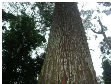
Fig 5 : Observation de la forme du tronc et de l'aspect aspect de l'écorce (moabi, Baillonella toxisperma , Sapotaceae)