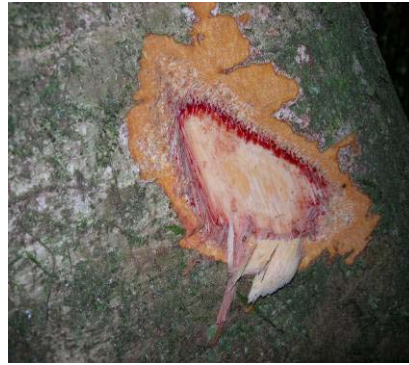
Fig 13 : Ex. d'écoulement rouge et lent (edji, Amphimas ferrugineus Caesalpiniaceae)