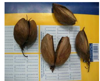
Fig 17 : Fruit d'izombé Testulea gabonensis Ochnaceae