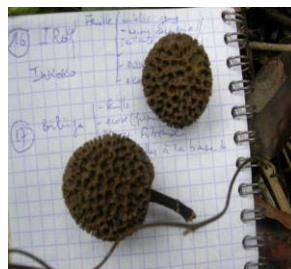
Fig 15 : Fruit du bilinga Nauclea diderrichii Rubiaceae