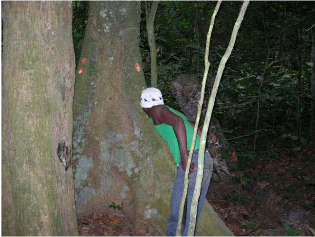
Fig 21 : Identification d'un arbre par un participant lors de l'évaluation.