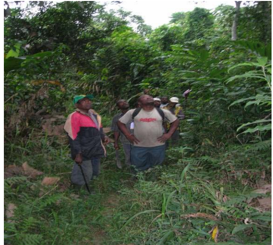
Fig 3 : Observation attentive de l'aspect d'un arbre.

Les enseignements sur détermination pratique des espèces observées ont porté sur :